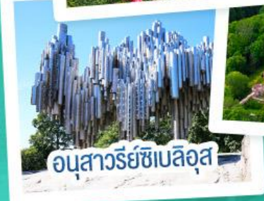
อนุสาวรีย์เซเบลิอุส

ฟินแลนด์ - เอสโตเนีย - ลัตเวีย - ลิทัวเนีย แวะเที่ยวเซี่ยงไฮ้