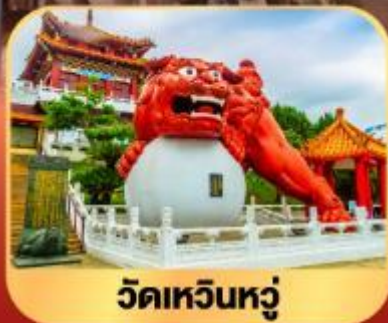
วัดเหวินหนู่