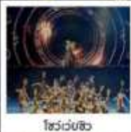
โชว์เวบซี