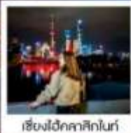
เชียงใหม่คลาสสิกไนท์