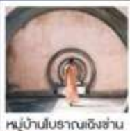
หมู่บ้านโบราณเชิงข่าน