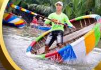
นั่งเรือกระดิ่ง