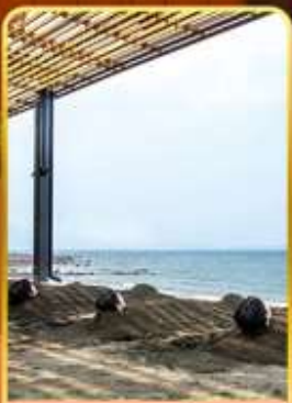
อาบทรายร้อน