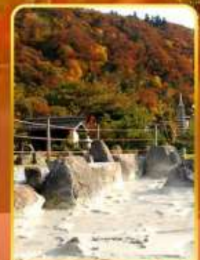
หุบเขานรกอุเซน