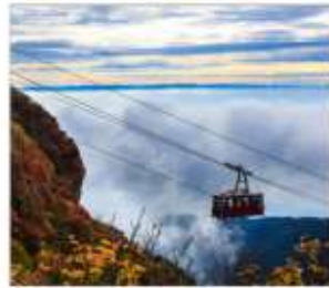
นั่งกระเช้าลอยฟ้าอุเนเซ็น