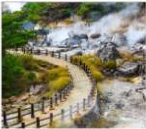
หุบเขานรกอุเนเซ็น