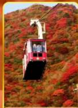
กระเช้าลอยฟ้าอุเซน