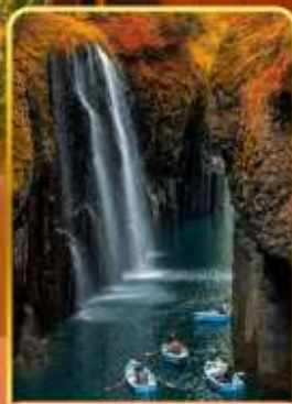
ทาคาจิโอะ(ไม่รวมสองเรือ)