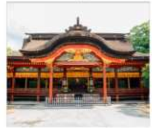
ศาลเจ้าดาไซฟู