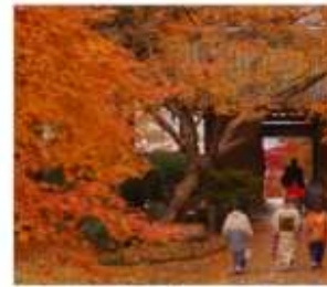
วัดไดโดเซนจิ