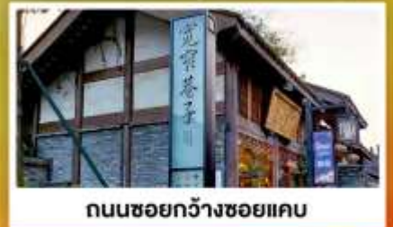
ถนนชอยกวางจ้งชอยแคบ