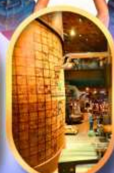
ร้านสตาร์บักส์