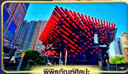
พิพิธภัณฑ์ศิลปะ