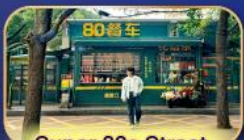
Super 80s Street