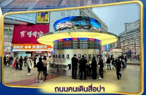
ถนนคนเดินสี่ป่า