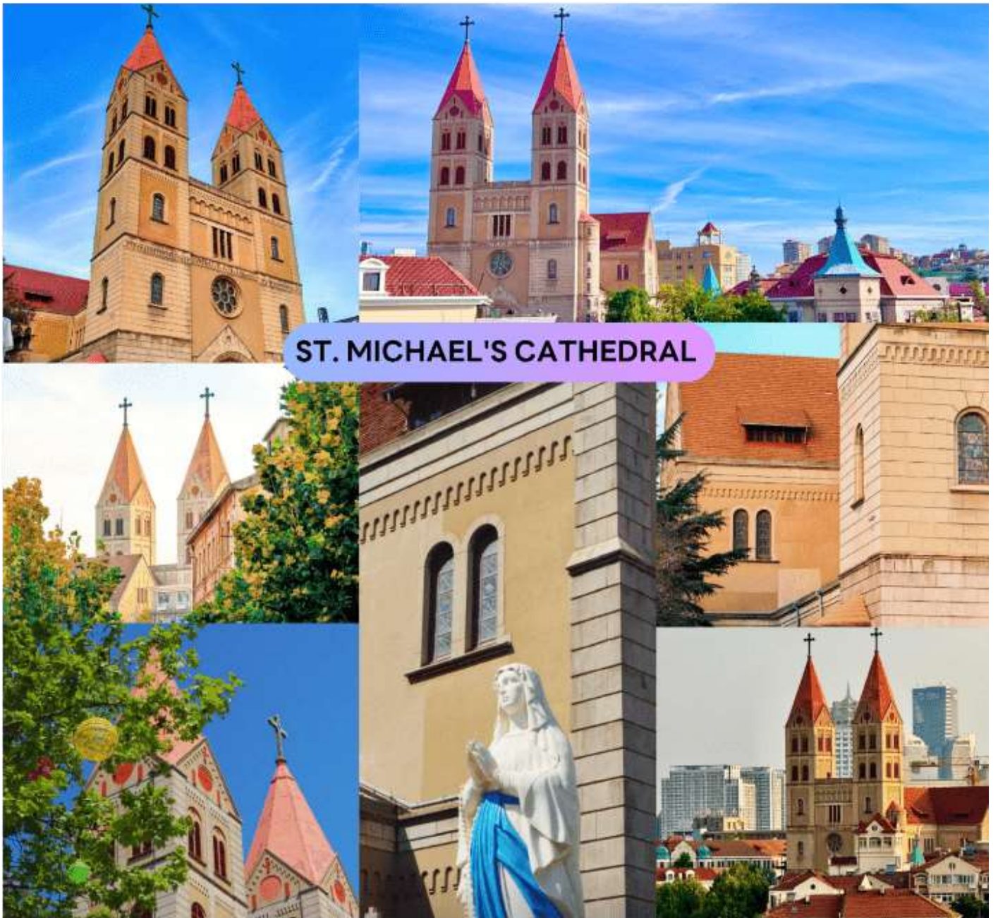
ST. MICHAEL'S CATHEDRAL

จากนั้นนำท่านสู่ ถนนจงซาน (Zhongshan Road) หนึ่งในย่านช้อปปิ้งเดินเล่นยอดนิยมของชิงเต่า ผสมผสานความทันสมัย และกลิ่นอายประวัติศาสตร์ได้อย่างลงตัว ถนนสายนี้เต็มไปด้วยร้านค้าแฟชั่น ร้านอาหาร คาเฟ่ ร้านของที่ระลึก ให้ผู้มาเยือนได้เลือกช้อปปิ้ง หรือสัมผัสวิถีชีวิตของชาวชิงเต่าอย่างใกล้ชิด ระหว่างเดินเล่นบนถนนจงซาน ท่านจะได้สัมผัสสถาปัตยกรรมสไตล์ยุโรปแบบโคโลเนียลที่เรียงรายอย่างสวยงาม พร้อมเพลิดเพลินไปกับบรรยากาศตึกตักของผู้ดูแลการผสมผสานระหว่างสถาปัตยกรรมคลาสสิก และความทันสมัยของร้านค้า ทำให้ที่นี่กลายเป็นจุดชมเมือง และถ่ายภาพยอดนิยม จึงเป็นแลนด์มาร์กสำคัญที่นักท่องเที่ยวไม่ควรพลาด หากต้องการสัมผัสทั้งวัฒนธรรม ช้อปปิ้ง และความตึกตักของเมืองชิงเต่า