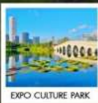
EXPO CULTURE PARK