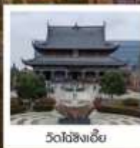
วัดไถ่ชิงเจี๋ย

พิเศษ!! รับประทานอาหาร ...ร้าน Michelin TAO TAO JU