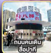
ถนนคนเดิน สี่ป่าทิ