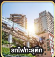
รถไฟฟ้าชุกติ๊ก