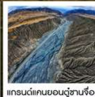
แกรนด์แคนยอนตู้ซานจื่อ