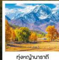
ทุ่งหญ้านาราที

ทัวร์คุณธรรม ไม่ลงร้านช้อปปิ้ง ไม่ขายออฟชั่น