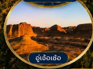
อู่เจ้อเซ่อ