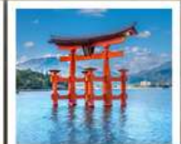
ศาลเจ้าอิตสึคุชิมะ