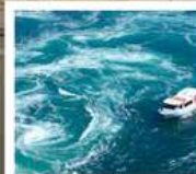
คลองเรือขมบ้านนาสุโตะ

คลองเรือขมบ้านนาสุโตะ / ซุปบึงย่านชินโซบาช / ตลาดปลาคุโรเมง / ซุปบึงย่านอุมาเดะ