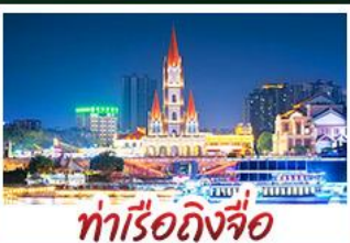
ท่าเรือกิ่งจื่อ

เขาชิงชู้สวนดอกไม้ตามฤดูกาล หมู่บ้านสไตล์ยุโรปเที่ยงยวี่ มังซิง เสี่ยวจัน ถนนคนเดิน NANNING ZHIYE - เมืองโบราณไท่ผิง ท่าเรือกิ่งจื่อ - ถนนคนเดิน สามตรอกสองซอย