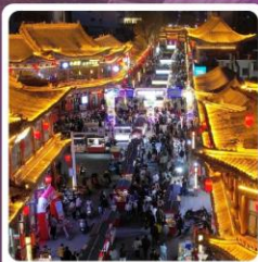
ตลาดจางเย่