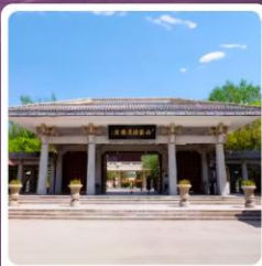
อุทยานประวัติศาสตร์จี้จวอน