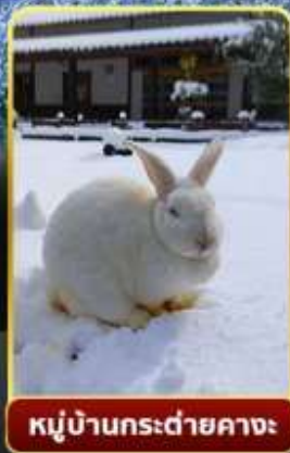
หมู่บ้านกระต่ายคางะ