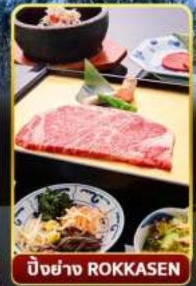
ปิ้งย่าง ROKKASEN