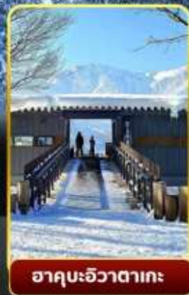
ฮาคุบะอิวาตาคะ