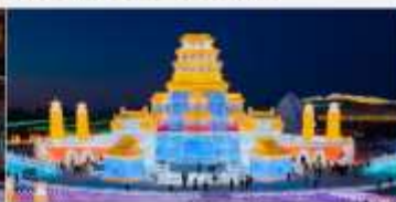
เทศกาลคอมไฟน้ำแข็ง