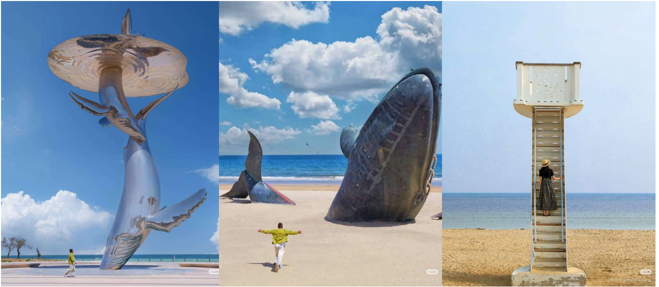
นำท่านเดินทางสู่ เมืองเผิงไห่ (ใช้เวลาเดินทางประมาณ 1 ชม.) เป็นเมืองริมทะเลสุดดีก๊ับในมณฑลซานตง ที่ถูกกล่าวขานมานานนับพันปีว่าเป็น “ถิ่นพำนักของเหล่าเทพเซียน”