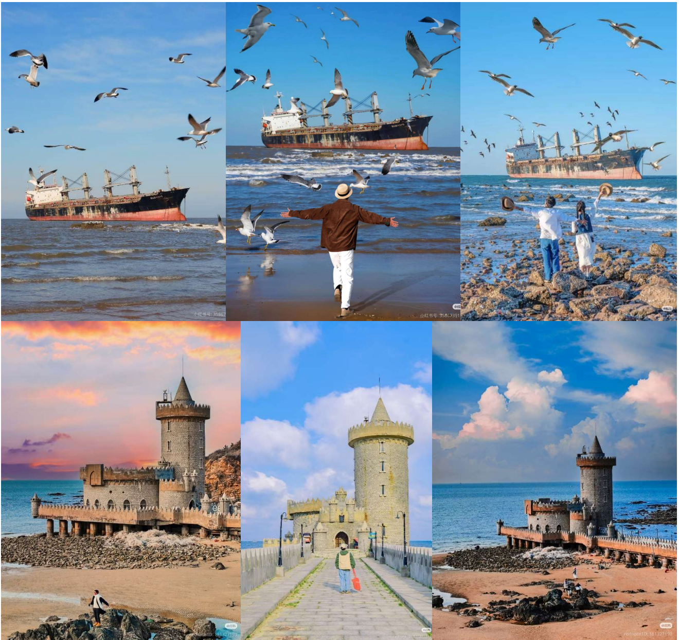
T2G-DLCTA001CZ ล่องเรือข้ามอ่าว ดำเหลียน ชิงเต่า...เหยียนไถ เว่ยไห่ เฝิงไหหล 6D 5N (CZ)

จากนั้นนำท่านชม เรือบลูวิส เรือบรรทุกสินค้าขนาดความยาว 190 เมตร ที่ถูกพายุไต้ฝุ่นถล่มทำให้เรือยักษ์นี้ เกยตื้น เกิดเป็นศิลปะกลางทะเลสุดคุณูล! ที่ดึงดูดให้นักท่องเที่ยวจากทุกมุมโลกมาดำช้ำกับเรือลำนี้ 1บอกเลยว่า... มาที่เว่ยไห่ต้องไม่พลาด "เรือบลูวิส (Bluevis)" เด็ดขาด! จากอุบัติเหตุ... กลายเป็นแลนด์มาร์กสุดอาร์ตแบบที่หาไม่ได้ที่อื่น จุดถ่ายรูปสุดโดดเดี่ยวแต่โรแมนติกในเว่ยไห่