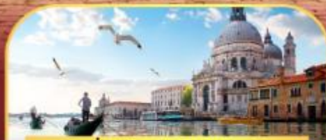
นั่งเรือสุทเกาะเวนิส