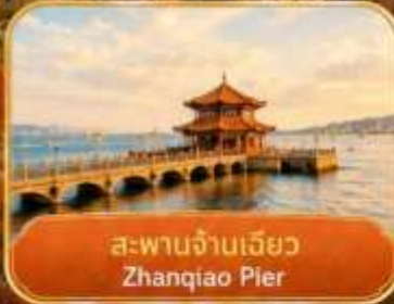
สะพานจันเจียว Zhanqiao Pier