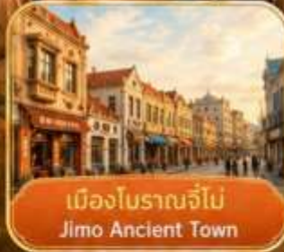
เมืองโบราณจี้โม Jimo Ancient Town