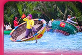
ส่องเรือกระดัง หมู่บ้านกิมทาน