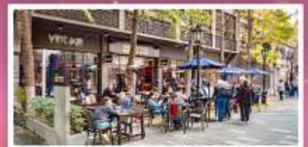
ชิวเกียนตี้