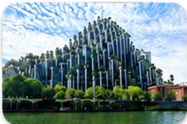
ต้นไม้พันต้น