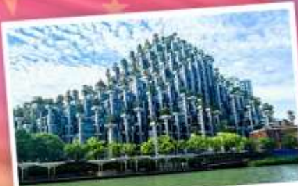
ต้นไม้พันต้น