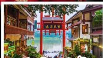
หมู่บ้านโบราณฉือชิว