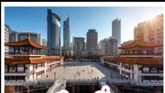
ตึกชุยซิ่ง

พระแกะสลักหินต้าจู้ - หลุมฟ้าสะพานสวรรค์ - เจานางฟ้า ตึกชุยซิ่ง - ตึกตะเกียบ - หมู่บ้านโบราณฉือชิว