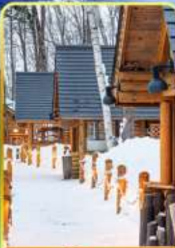
มิงเกิ้ลเกอเร