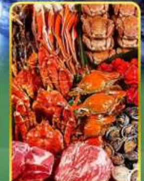
ปิ้งย่างพรีเมียมมันตะ

ออนเซ็น 2 คั้น มน.กระเป๋า 1 ใบ 23 กก 7Days 5Night