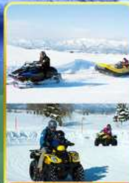
BIBAI SNOW LAND