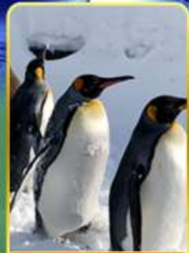
พาเหรดกเพนกวิน