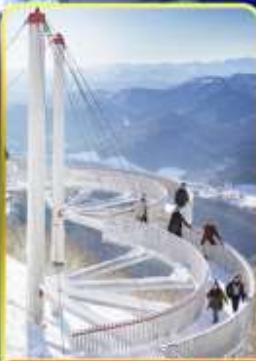
ระเบียงหมอกน้ำแข็ง