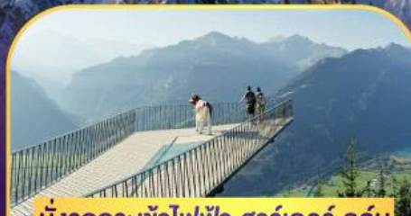
นั่งรถกระเช้าไฟฟ้า ชาร์เตอร์ คูลัม