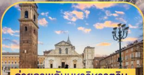
ถ่ายภาพกับมหาวิหารคูริน