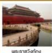
พระราชวังกรุงปักกิ่ง