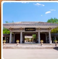
อุทยานประวัติศาสตร์จิวจวน