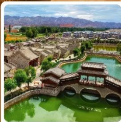
หมู่บ้านตันเซี่ยโป่ว