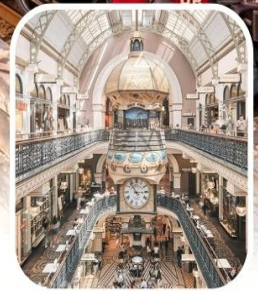
QUEEN VICTORIA BUILDING