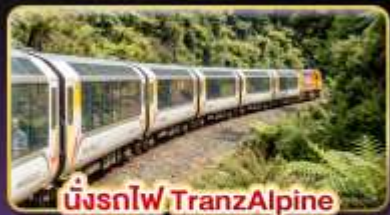
นั่งรถไฟ TranzAlpine