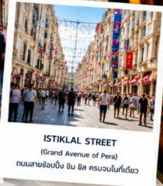
ISTIKLAL STREET (Grand Avenue of Pera) ถนนสายช้อปปิ้ง อิม บิล ครบจบในที่เดียว