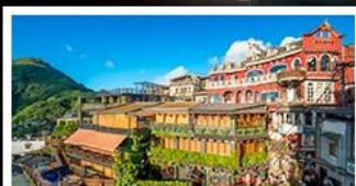
หมู่บ้านโบราณจัวเฟิ่น