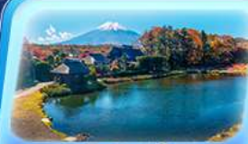
โอชิโนะอ๊กโก