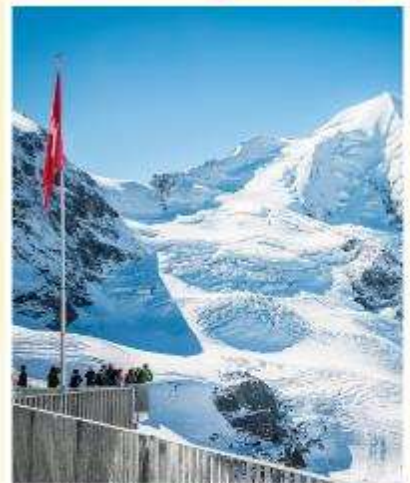
DIAVOLEZZA Piz bernina Peak