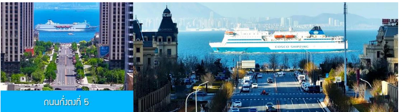
ถนนกั๋วตง 5