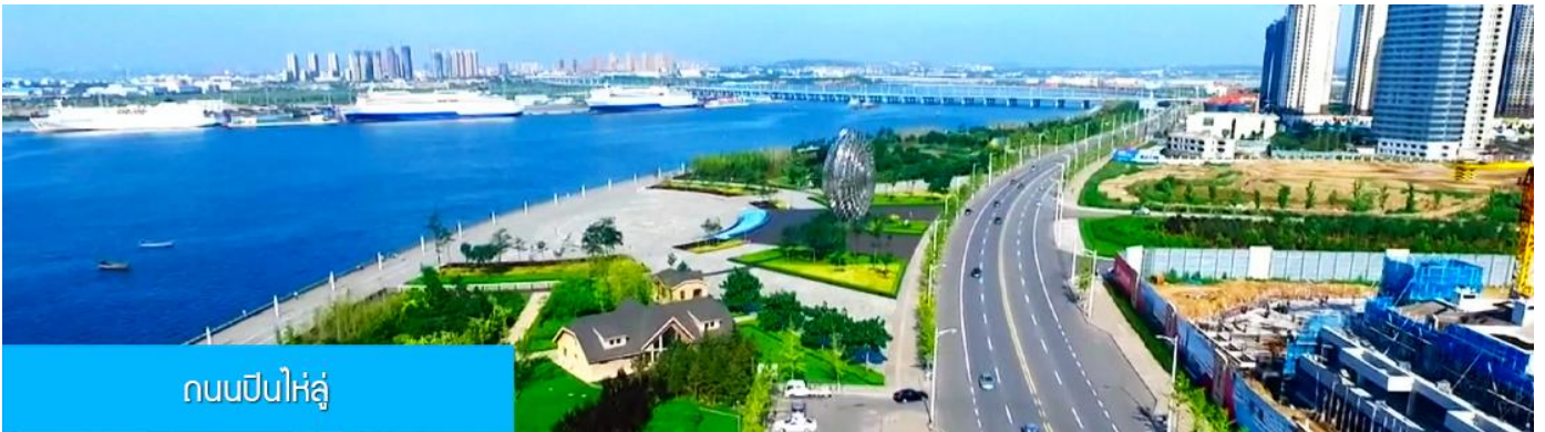
ถนนปินไห่หลู่

ล้อมด้วยตึกระฟ้าที่ทันสมัย ภายในมีบ่อน้ำพุคนตรี ลานหญ้าขนาดใหญ่ และลานกว้างสำหรับจัดกิจกรรม กลางแจ้ง อาทิ เทศกาลเบียร์นานาชาติ การแข่งขันวิ่งมาราธอน งานแฟชั่นนานาชาติเมืองต้าเหลียน ฯลฯ