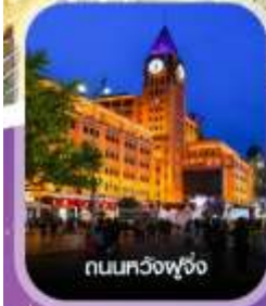
ถนนหลวงฟู้จิ่ง