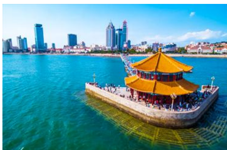
สะพานเทียนเจียว

เช้า รับประทานอาหารเช้า ณ ห้องอาหารของโรงแรม (1)