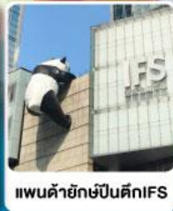
แพนด้ายักษ์ปีนตึกIFS