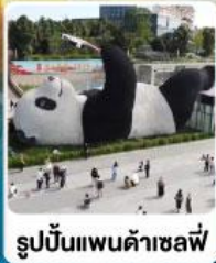
รูปปั้นแพนด้าเซลฟี