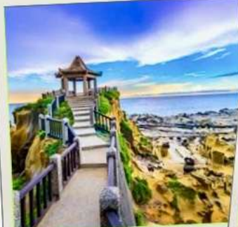
อุทยานเกาะเหอผิง