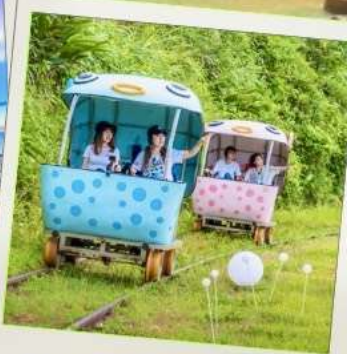
Shen'ao Rail Bike