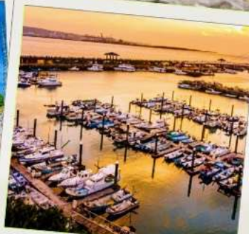
ท่าเรือประมงตั้นสุ่ย