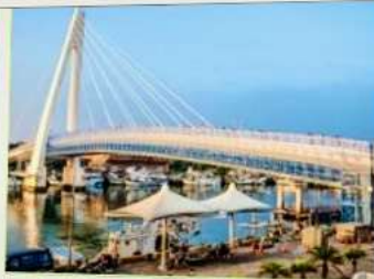
สะพานคู่รักตั้นสุ่ย