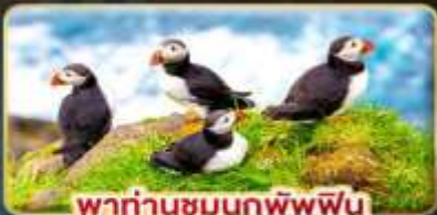
พาท่านชมนกพัฟฟิน