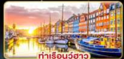
ท่าเรือบูธาว