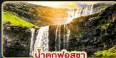
น้ำตกฟอสซา