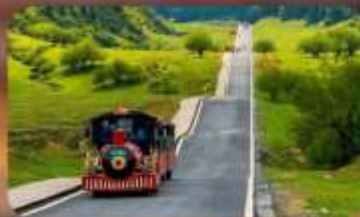
หุบเจานางฟ้า