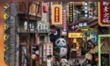
หมู่บ้านสีปาที