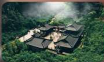
อุทยานหลุมฟ้า