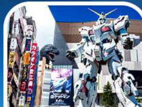
ช้อปปิ้งชินจูกุ+กินดัมยักษ์