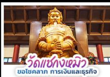
วัดแห่งกงเหมียว ขอโชคลาภ การเงินและธุรกิจ