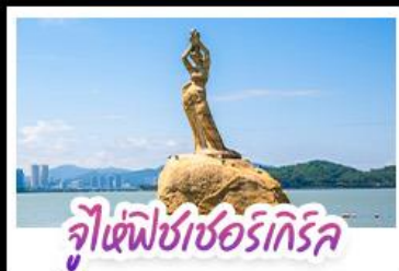
จุฬาราชมนตรี