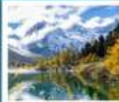
ปี่ฝิ่งโกว