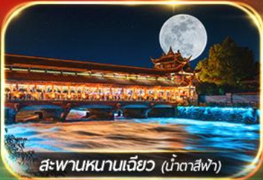
สะพานหนานเจียว (น้ำตาสีฟ้า)