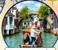
เมืองโบราณจูเจียเจีย