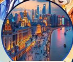
หาดไวทาน