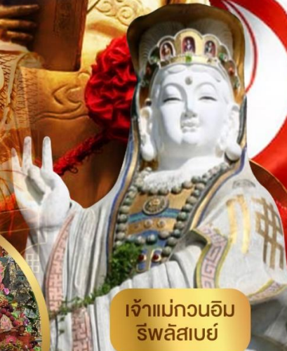
เจ้าแม่กวนอิม ริพลีสเบย์