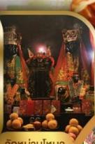
วัดบ้านโหนด