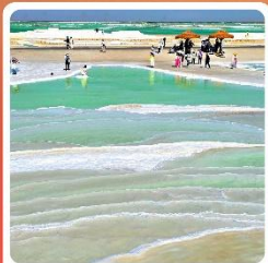
ทะเลสาบเกลือจาเอ้อหาน