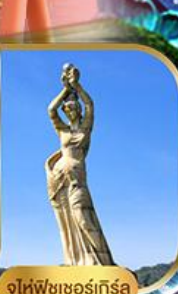
จูไห่ฟิชชอร์ทิวรา