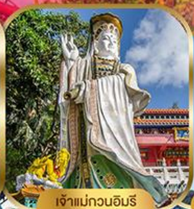
เจ้าแม่กวนอิมรีพลัสเบย์